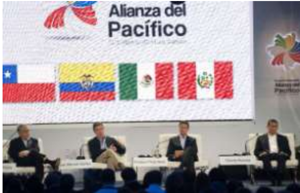
La Alianza del Pacífico aprobó el jueves pasado la adhesión de Paraguay.

El alto representante del Mercosur, el brasileño Iván Ramalho, afirmó al diario uruguayo El País que “debe ser el bloque económico el que negocie algo así y no Uruguay solo”, al aludir a la intención del país charrúa de ser socio pleno de la Alianza del Pacífico. En la Cumbre de Cali, Colombia, trascendió que el Brasil pidió que el Mercosur ingrese a la Alianza y fue rechazado.